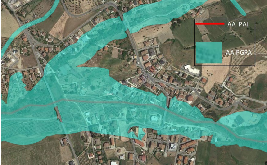
Comune di Luzzi (CS) Torrente Ilice – Stralcio mappa del rischio idraulico ed aree di attenzione PGRA - Piano vigente